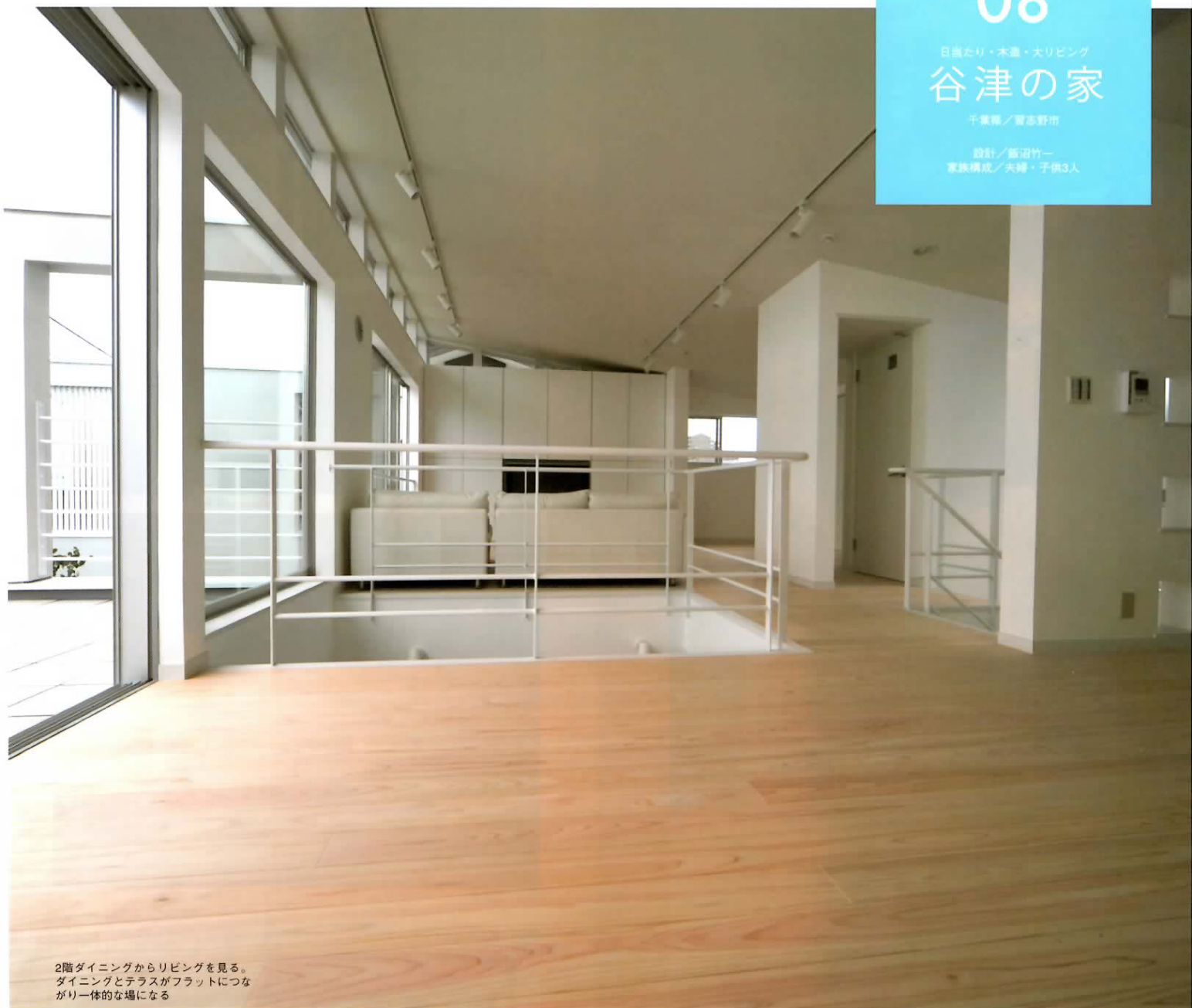
2階ダイニングからリビングを見る。 ダイニングとテラスがフラットにつな がり一体的な場になる